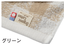
グリーン (チェック)